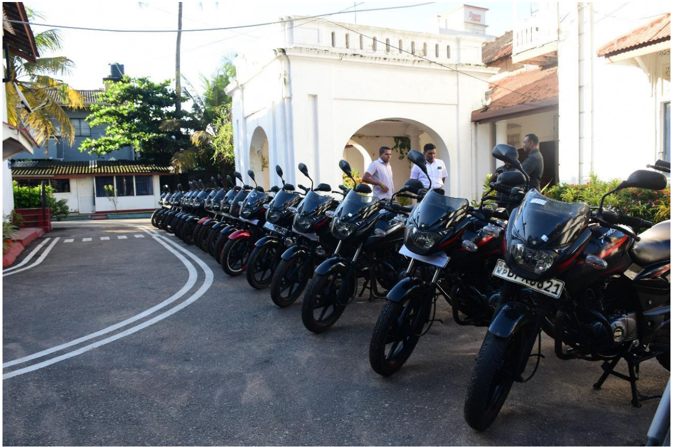
මාධ්‍ය ප්‍රකාශක කාර්යාලය පොලිස් මාධ්‍ය කොට්ඨාසය.