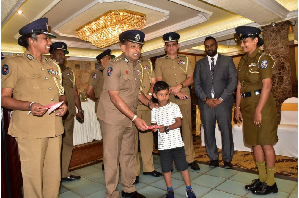
මාධ්‍ය ප්‍රකාශක කාර්යාලය පොලීස් මාධ්‍ය කොට්ඨාසය.