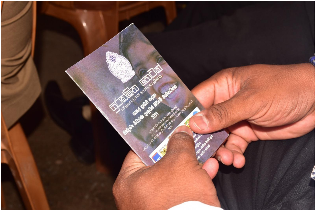
ಮದ್ಯಾ ಪ್ರಕಾಶನ ಕಾರ್ಯಾಲಯ ಪಾಲಿಸಿ ಮದ್ಯಾ ಕಾರ್ಯಾಲಯ.