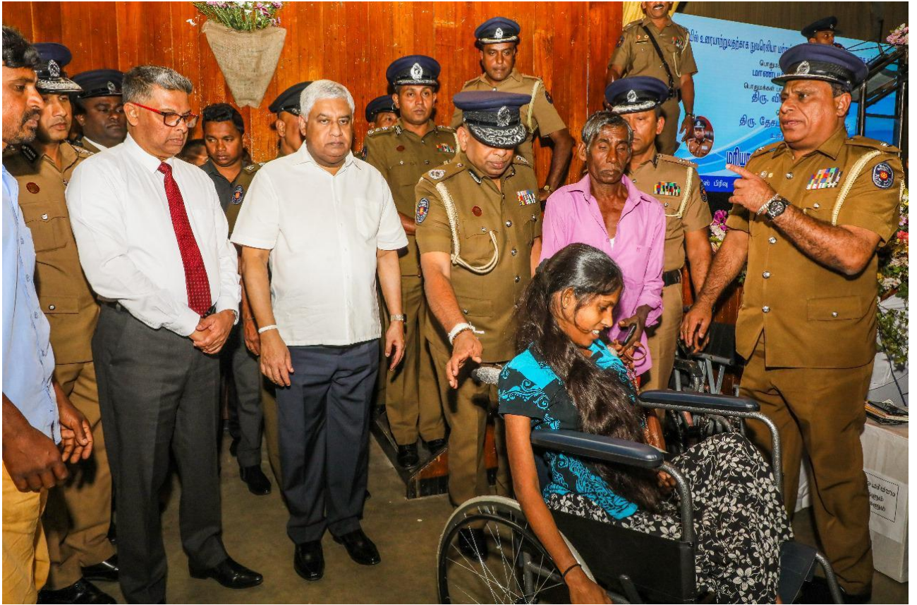
මාධ්‍ය ප්‍රකාශක කාර්යාලය පොලිස් මාධ්‍ය කොට්ඨාසය.