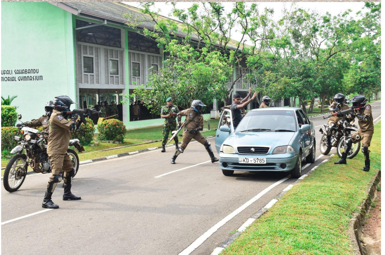
මාධ්‍ය ප්‍රකාශක කාර්යාලය පොලිස් මාධ්‍ය කොට්ඨාසය.