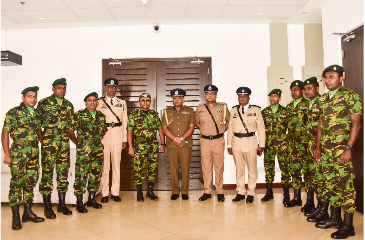
මාධ්‍ය ප්‍රකාශක කාර්යාලය, පොලිස් මාධ්‍ය කොට්ඨාසය.