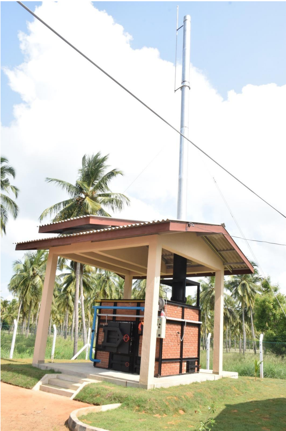
මාධ්‍ය ප්‍රකාශක කාර්යාලය පොලිස් මාධ්‍ය කොට්ඨාසය.