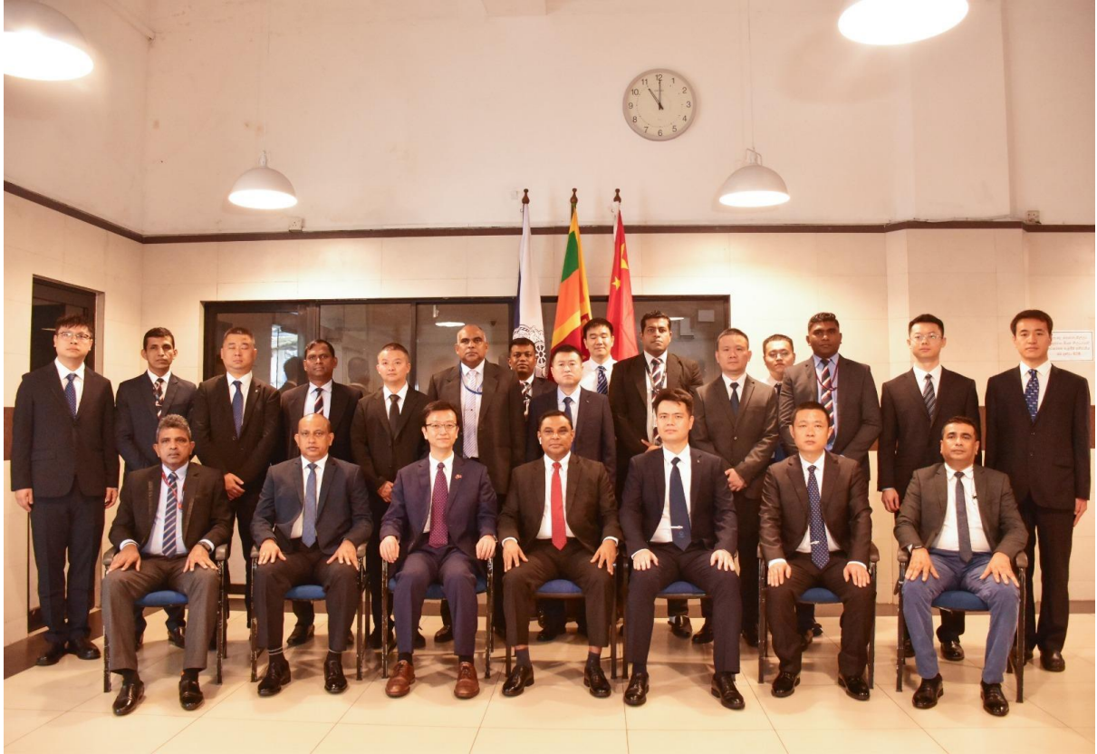
පොලිස් මාධ්‍ය කොට්ඨාසය.