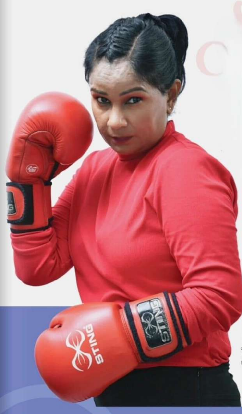
පොලිස් මාධ්‍ය කොට්ඨාසය.